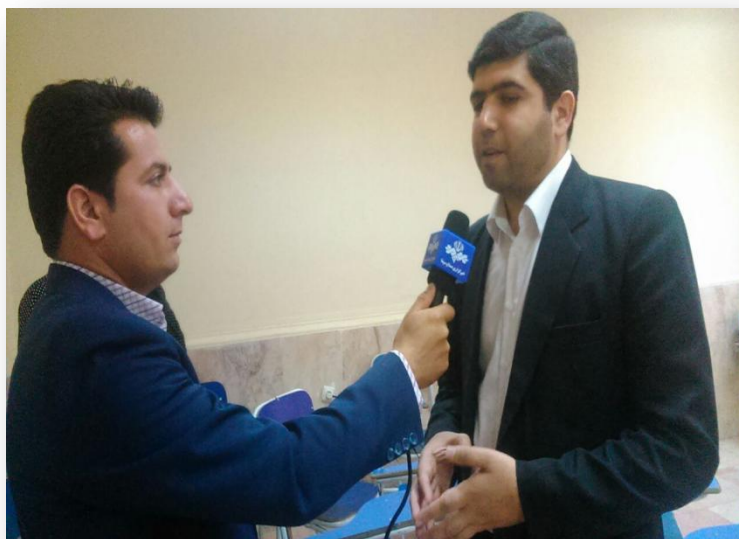
مصاحبه صداوسیما با مرکز خوزستان با معاون پژوهش و فناوری دانشگاه آزاد اسلامی مسجدسلیمان